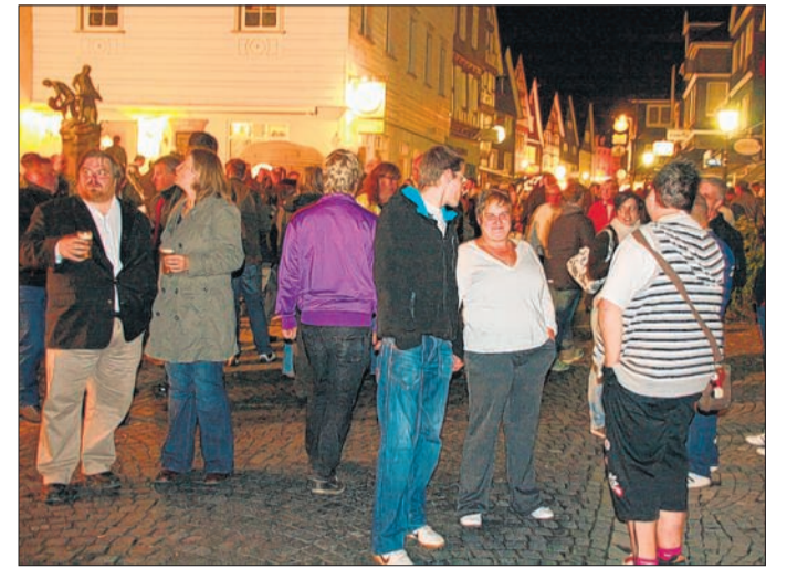
Beim Laaspher Altstadtfest kann man in gemütlichem Ambiente durch die Altstadt flanieren.