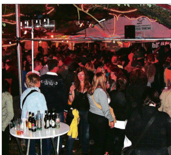
Für beste Stimmung sorgt der Rockpalast Laasphe auf dem Platz an der Mauerstraße.

Nicht fehlen darf die beliebte Rocktail-Bar. Dort mixen die Mitglieder und Helfer Euch ganz frisch einen von sechs leckeren Cocktails: Tequila Sunrise, Spanish Temptation oder Redemption, Zombie, Barracuda oder Fruit Rocktail.