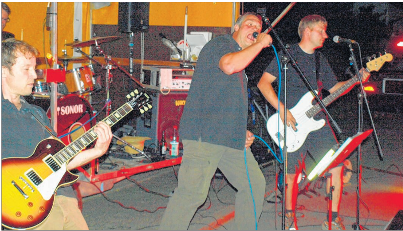
Die Wittgensteiner Cover-Band „Grandmama's Backside“ sorgt am Samstagabend im Rockpalast des Altstadtfestes für die Musik. Daneben haben sich zahlreiche weitere Bands angekündigt.

Schon bald trafen sich die einstigen Veranstalter und Helfer und beschlossen, einen Verein zu gründen. Nach einer Absprache mit dem Westdeutschen Rundfunk (WDR) war der Name auch schnell beschlossene Sache: „Rockpalast Laasphe e.V.“ Ein zentraler Aspekt der Vereinsphilosophie war und ist die Unterstützung und die Pflege der heimischen Musikkultur.